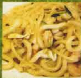
Udon Japonais aux Fruits de Mer Seafood Udon