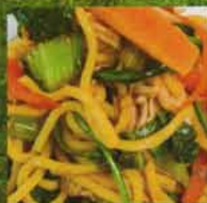
Nouilles Style Shanghai Shanghai Style Noodles