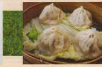
Dumpling au Porc & Légumes à la Vapeur Steamed Pork & Vegetable Dumplings