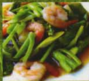
Crevette aux Broccoli Chinois Shrimps with Chinese Broccoli