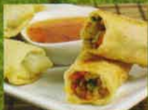
Egg Rolls au Porc Pork Egg Rolls