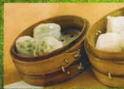
Dumpling au Pétoncles & Crevette Scallop & Shrimp Dumplings