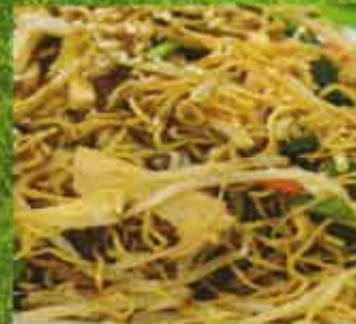
Chow Mein aux Germes d'haricots Beansprout Chow Mein