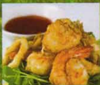
Fruits de Mer Sautés Sel & Épices Seafood Sauted Salt & Pepper