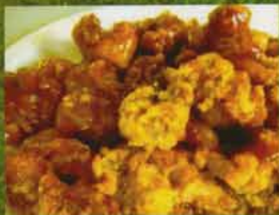
Général Tao / General Tao