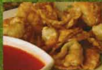
Won Ton Frits Fried Won Ton