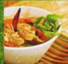
Soupe Tom Yum avec Crevettes Tom Yum Soup with Shrimp

**SVP informez-nous s'il y a des allergies alimentaires** Please inform us if there are any food allergies