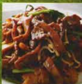
Nouilles de Riz Sautés aux Boeuf Beef Stir-Fried Rice Noodles