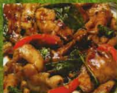
Poulet Style Thaïlandais Chicken Thai Style