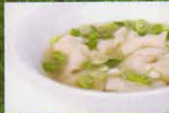
Soupe Won Ton Won Ton Soup