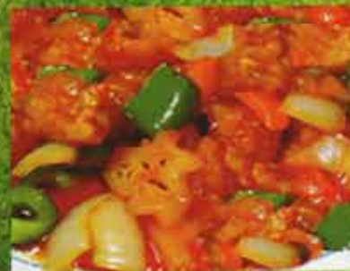
Poulet Aigre-Doux aux Ananas Sweet & Sour Chicken with Pineapple