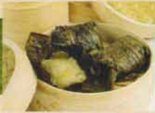
Riz Collant au Porc Pork Sticky Rice