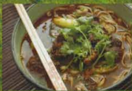
Soupe au Ragoût de Boeuf Style Chinois Chinese Style Beef Stew