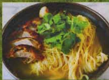
Soupe aux Nouilles avec Canard B.B.Q. B.B.Q. Duck Noodle Soup