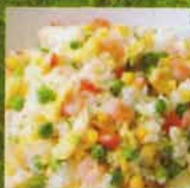
Yang Chow (Crevette, Porc) (Shrimp, Pork)