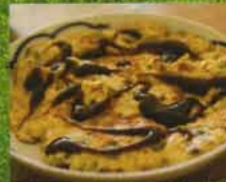
Omelette Foo Yang Foo Yang Egg Omelette