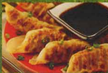
Dumpling frit au Poulet Pan-Fried Chicken Dumplings