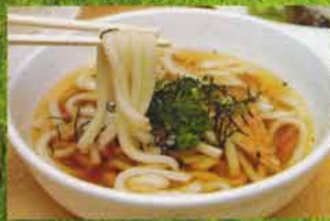
Soupe aux Nouilles Udon Udon Noodle Soup