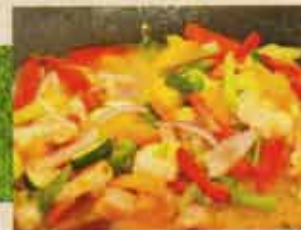
Fruits de Mer Style Thaïlandais Thai Style Seafood