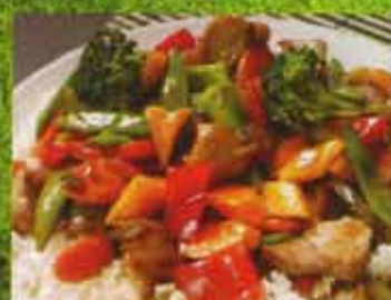
Poulet aux Légumes sur du riz blanc Chicken Vegetables on steamed rice