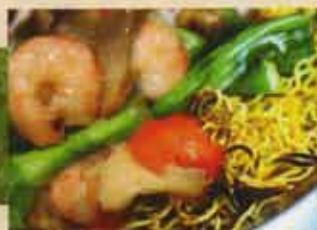
Chow Mein Cantonais Cantonese Style Chow Mein