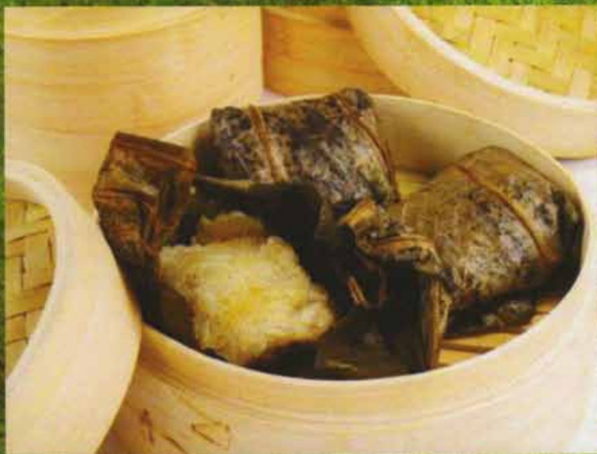
Dumpling au Porc & Légumes Pork & Vegetable Dumplings.