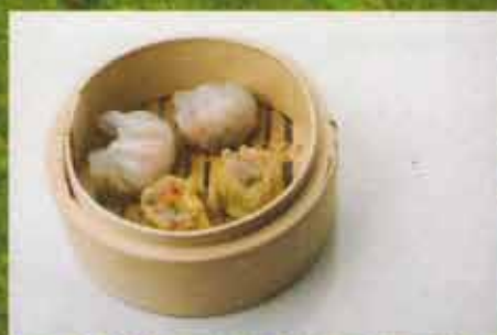
Dumpling Har Kao/Siu Mai Har Kao/Siu Mai Dumpling