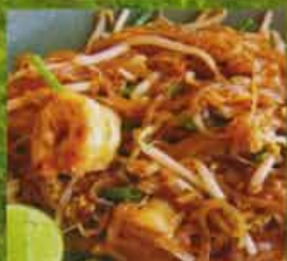
Nouilles Pad Thai Pad Thai Noodles