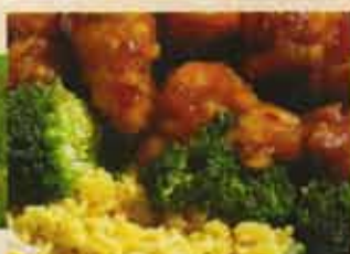
Poulet Général Tao General Tao Chicken