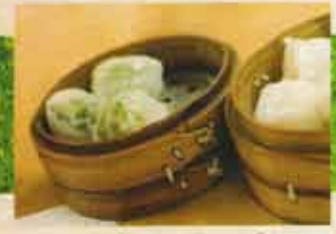
Dumpling au Coriandre Coriander Dumplings