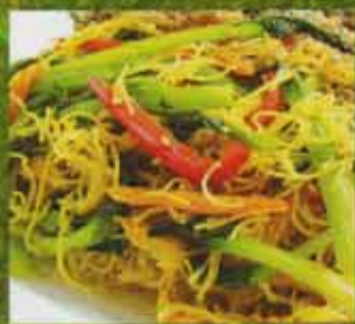
Vermicelles Style Singapore Singapore Style Vermicelli