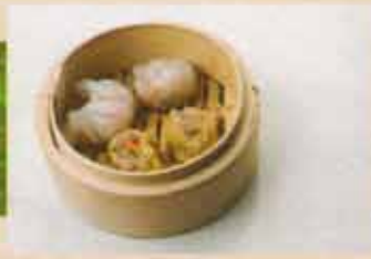
Dumpling Har Kao/Siu Mai Har Kao/Siu Mai Dumpling